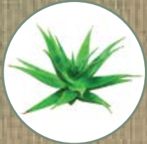
ALOE BARBADENSIS MILLER