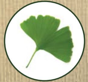
GINKGO BILOBA L.

مستخرج من جينكو بيلوبا: له تأثير تحفيزي كبير على دوران الأوعية الدقيقة الجلد، وتحسين إيصال التغذية إلى الجذور الحرة التي تسبب تحلل الهيدرولبيدك