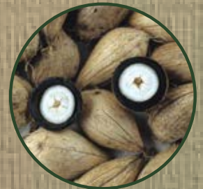
ASTROCARYUM MURUMURU SEED

زبدة المورومورو كانت تستعمل سابقاً كمهدأ، ووللتطيب الشعر وتحتوي على نسبة عالية من الفيتامين A، وتجعل الشعر براقاً بينما يخلق حاجز حماية لمكافحة فقدان الرطوبة.