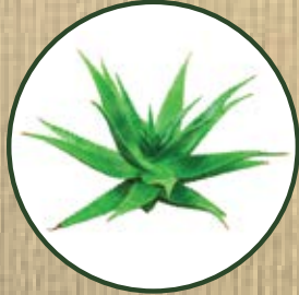
ALOE BARBADENSIS MILLER

IT. ESTRATTO DI ALOE BARBADENSIS: oltre alle sue molteplici virtù, è in grado di aumentare la microcircolazione del cuoio capelluto, aiutando il ripristino dei bulbi danneggiati.