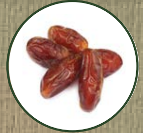
BALANITES ROXBURGHII SEED

RU. Масло пустынного финика содержит сапонины и флавоноиды, оказывает увлажняющее и антиоксидантное действие, блокирует негативное влияние свободных радикалов. Закрывает чешуйки волоса, помогая избежать преждевременного вымывания красителя.