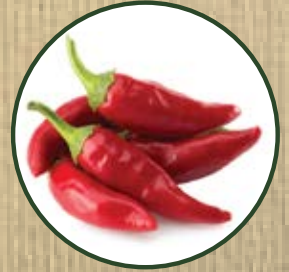
RED HOT CHILI PEPPERS

مستخلص من الفلفل الاحمر: بفضل وجود مادتي الفلافونويد، وفيتامين A و C والبروتينات والسابونين، وتحفيز دوران الأوعية الدقيقة في فروة الرأس زيادة المعروض من المواد الغذائية الضرورية لنمو الشعر