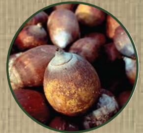
ORBIGNYA OLEIFERA OIL

RU. Масло ореха бabaçu имеет защитные свойства, питает и смягчает волосы. Защищает волосы, придавая им мягкость и блеск.