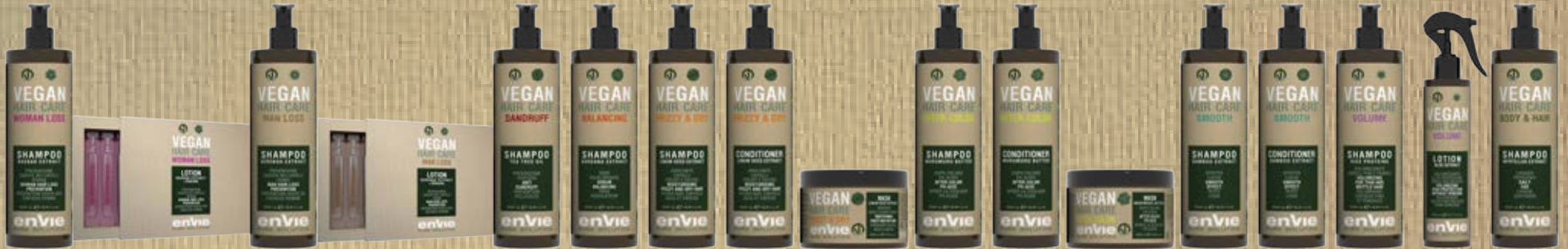
EN850 EN858 EN851 EN859 EN852 EN853 EN854 EN860 EN861 EN863 EN864 EN865 EN856 EN862 EN855 EN857 EN866