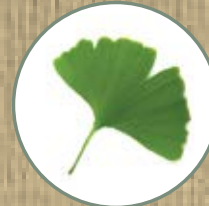
GINKGO BILOBA L.