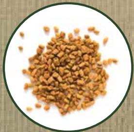
TRIGONELLA FOENUM GRAECUM

وجودها من الصمغ، الفلافونويد والعصص والمنجنيز وفيتامين C.